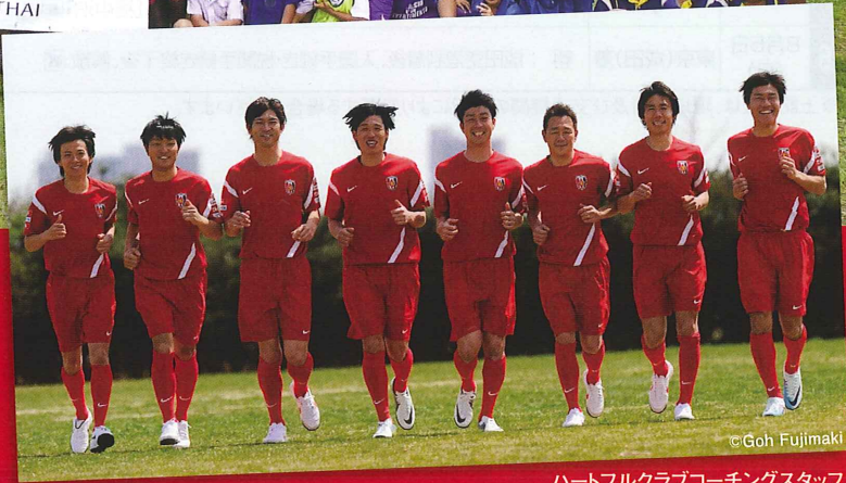
ハートフルクラブコーチングスタッフ

Point 1 国際交流 / 日本の子供達とタイの子供達と一緒にハートフルサッカースクールを開催