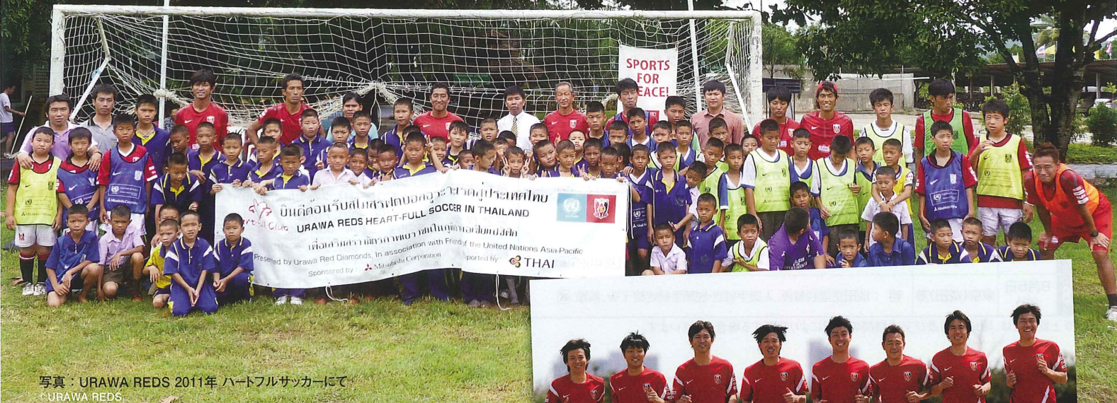
写真：URAWA REDS 2011年 ハートフルサッカーにて