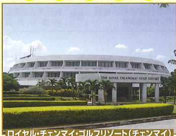
ロイヤル・チェンマイ・ゴルフリゾート(チェンマイ)