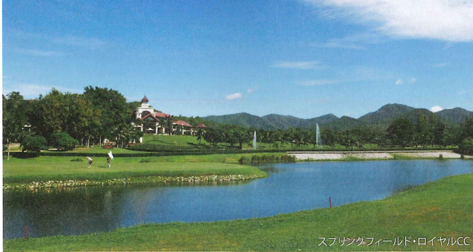
スプリングフィールド・ロイヤルCC