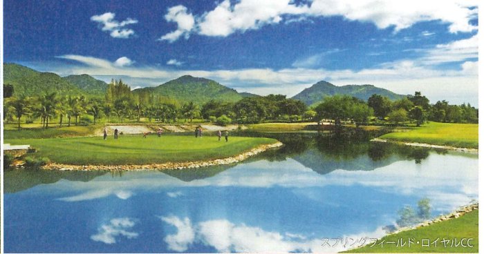
スプリングフィールド・ロイヤルCC